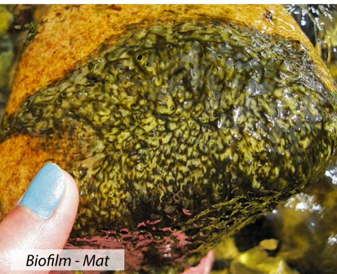
Biofilm - Mat

Aparecen en la superficie de las piedras formando tapetes (« biofilm ») de color verde-oscuro, a veces de varios colores formando vetas, que pueden soltarse y acumularse en los bordes (flóculos).