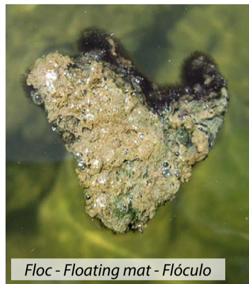
Floc - Floating mat - Flóculo