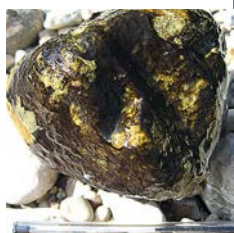
Biofilm à cyanobactéries